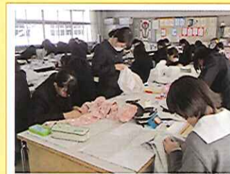
ファッション造形基礎