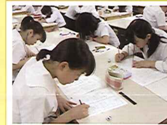
デザイン画講習会