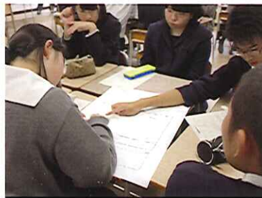
グループで話し合い中

縦割りLHRとは、クラス・学年・学科を越えてグループをつくり、全校生徒が共通の課題で意見交換をする時間です。今年の課題は「松籟祭大反省会」。今年の松籟祭について生徒一人ひとりが振り返り、来年に生かすための活発な意見を出し合うことができました。