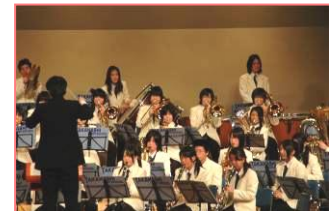
スプリングコンサート