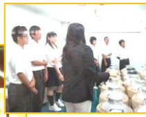
オープンスクール(夏)